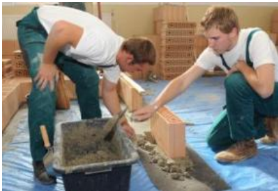
Pripravila Ing. Slávka Šoltéssová

Ako najlepší sa ukázali žiaci z Bardejova.