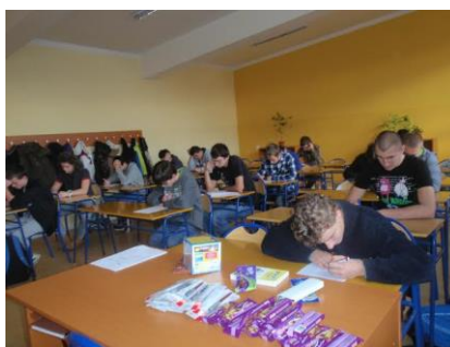
Pripravila Mgr. Renáta Juhászová